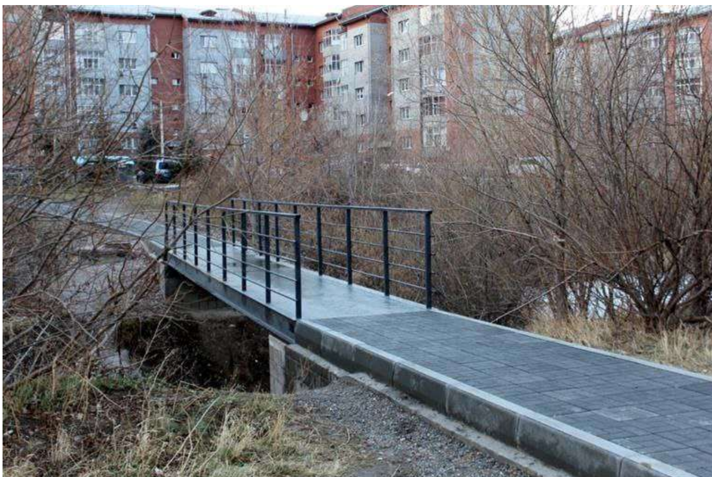
Фотофиксация текущего состояния общественной территории