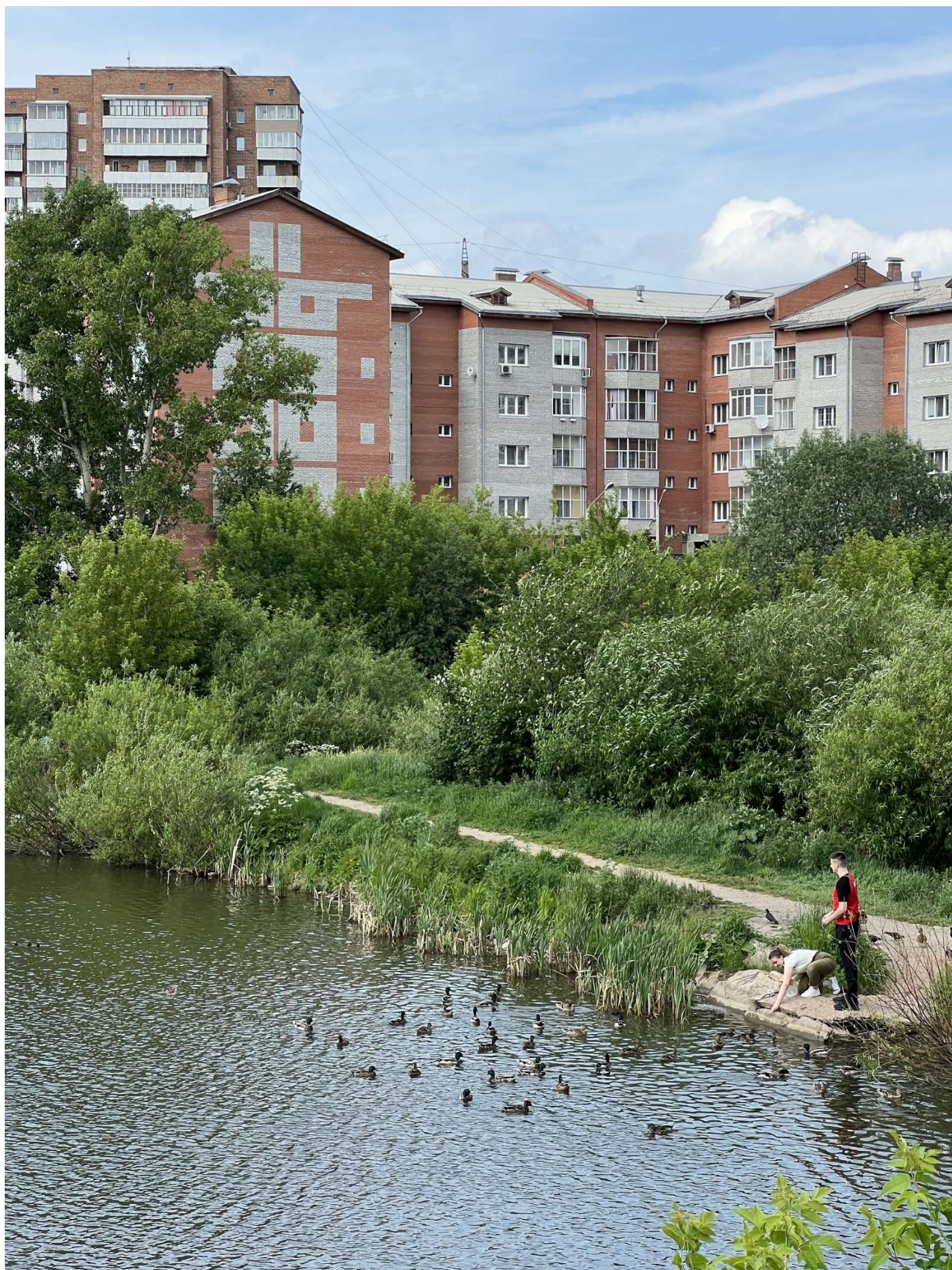
Фотофиксация текущего состояния общественной территории