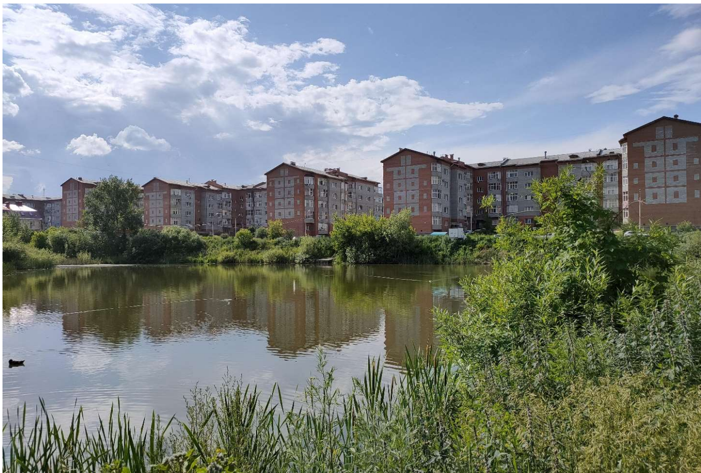
Фотофиксация текущего состояния общественной территории