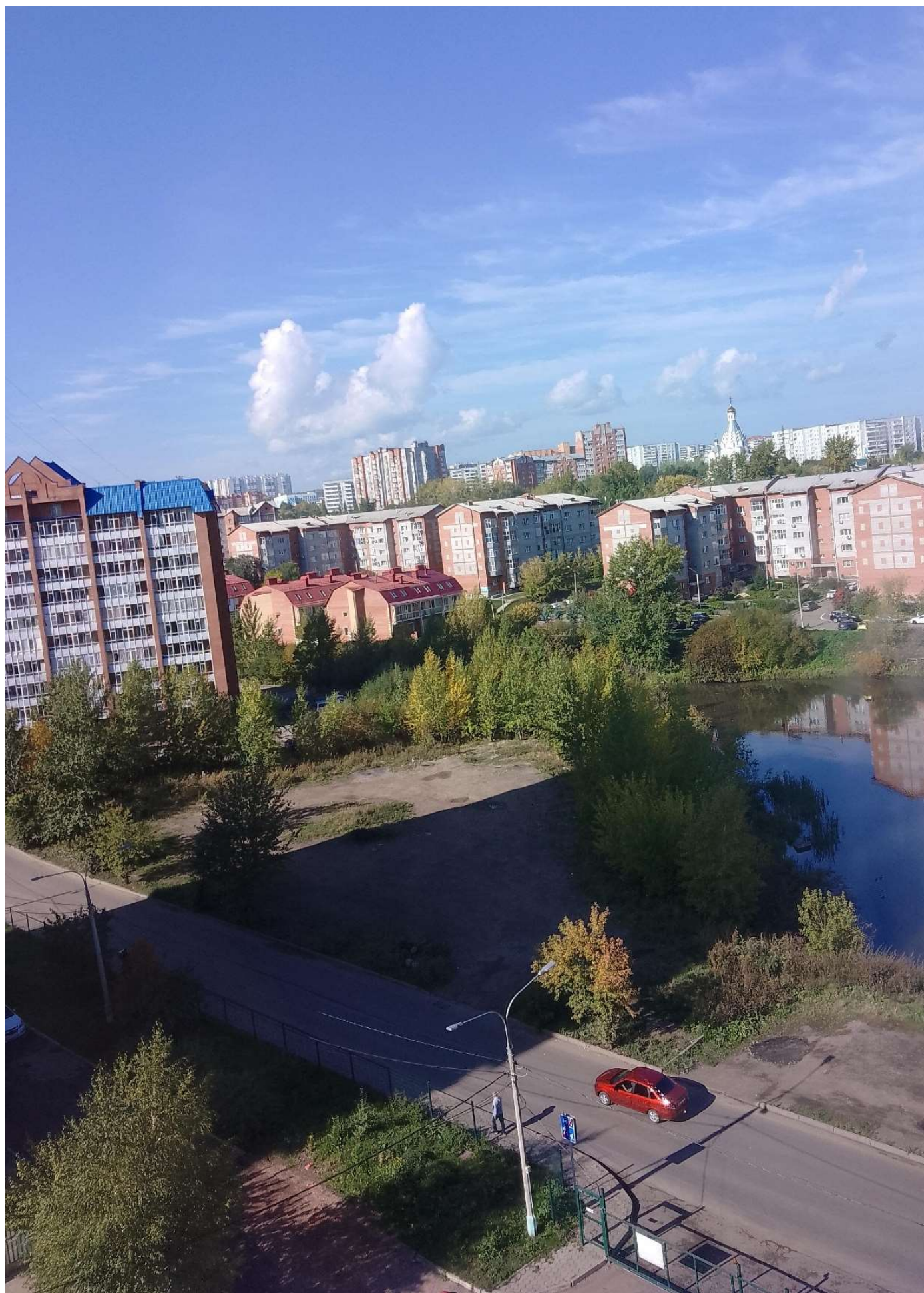
Фотофиксация текущего состояния общественной территории