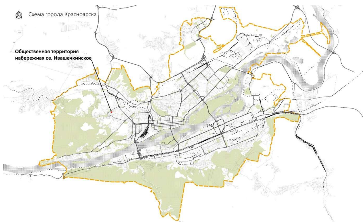
Схема №1. Местоположение территории

В рамках разработки проектного решения предлагается создать комфортное общественное пространство для отдыха у воды. Проектирование необходимо осуществить с учетом планировочных ограничений (охранные зоны водных объектов и инженерных сетей), ландшафтных особенностей места и перспективной трансформации территорий вдоль русла ручья Серебряный в единое линейно-рекреационное пространство от Лыжного стадиона «Ветлужанка» до станции метро «Высотная». Проектное решение должно обеспечивать безопасность и безбарьерность формируемой среды, удобство и простоту эксплуатации, при этом обязательным условием является проектное предложение малой архитектурной формы (арт-объекта), которая отражала бы идентичность места и могла бы стать знаковым элементом для нового общественного пространства.