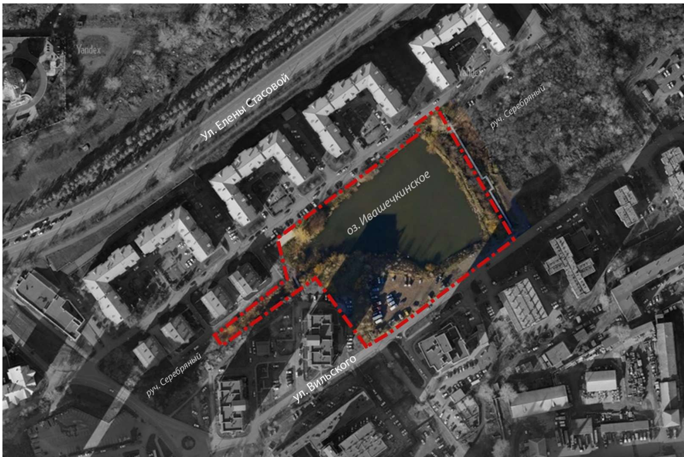
Схема №2. Границы территории